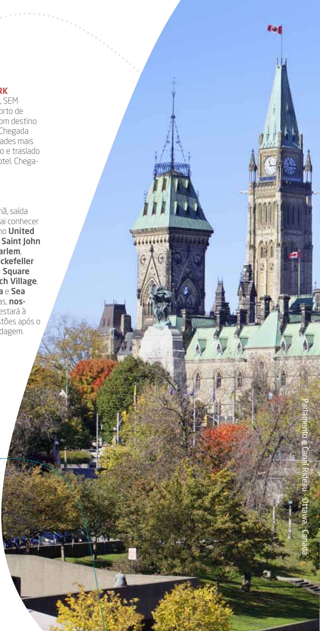
Parlamento e Canal Rideau - Ottawa, Canadá.

Café da manhã no hotel. Pela manhã, saída para visita à cidade , onde você vai conhecer importantes pontos turísticos, como United Nations, Central Park, Catedral Saint John Divine, Columbia University, Harlem, Lincoln Center, 5th Avenue, Rockefeller Center, Times Square, Madison Square Garden, Empire State, Greenwich Village, Soho, Chinatown, City Hall Area e Sea Port . Como as opções são inúmeras, nosso guia brasileiro profissional estará à disposição para dar dicas e sugestões após o passeio. Retorno ao hotel e hospedagem.